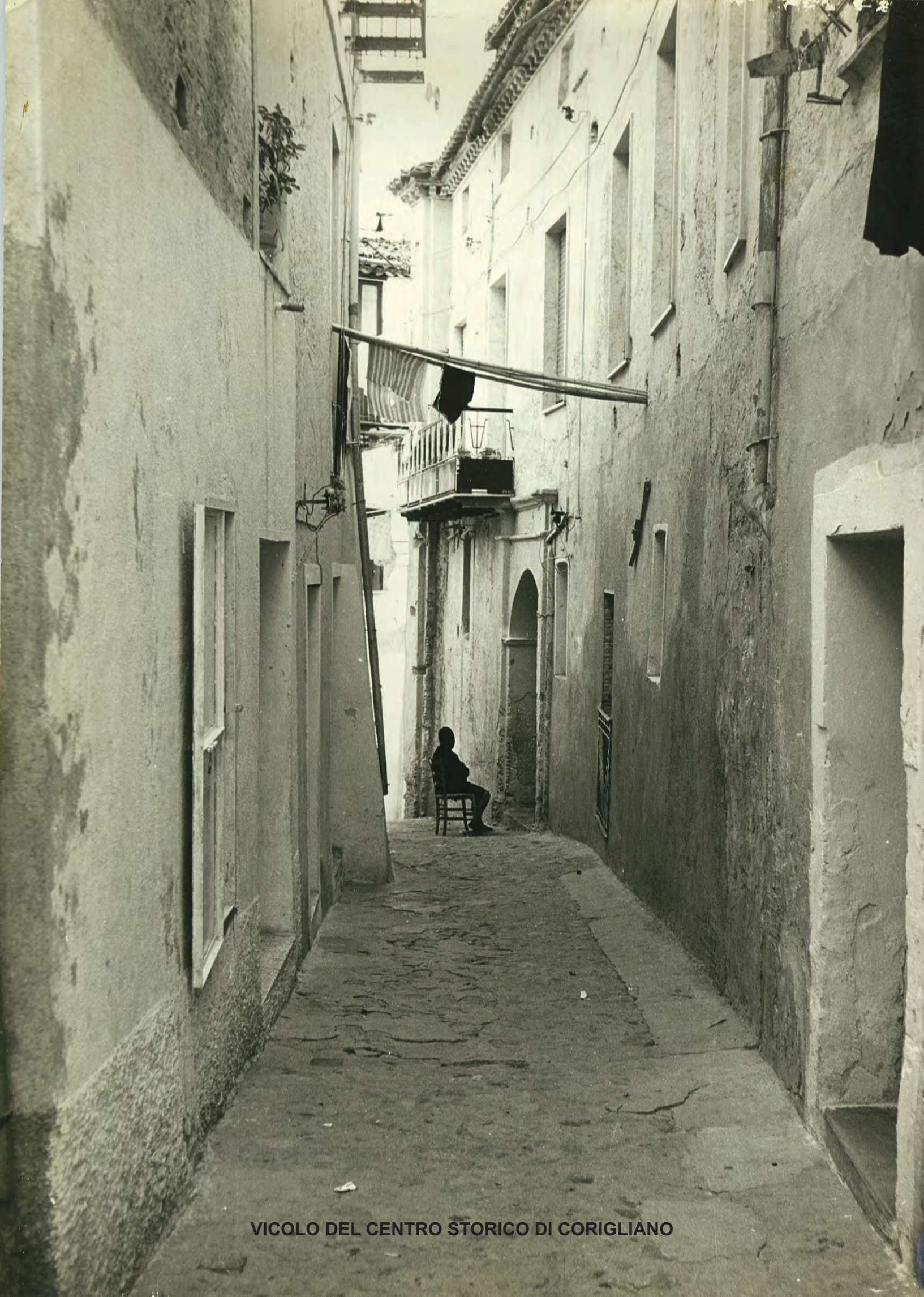
VICOLO DEL CENTRO STORICO DI CORIGLIANO