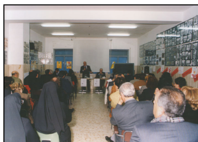
Nelle foto alcune immagini della presentazione