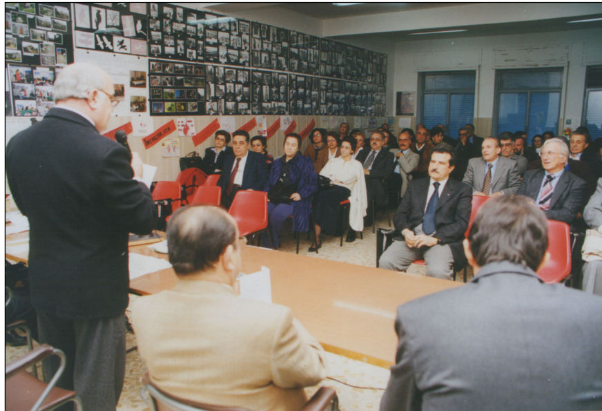
Rossano, 18 novembre 2000 - Scuola Media "L. Da Vinci"