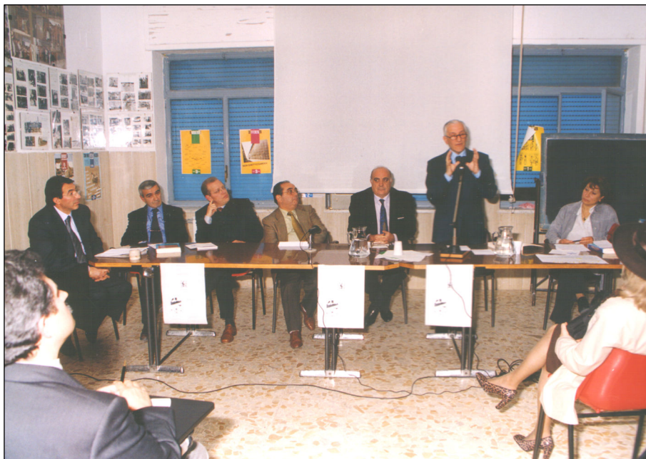
Rossano, 18 novembre 2000 – Scuola Media “L. Da Vinci”