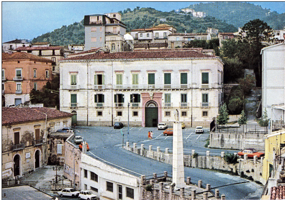
Rossano, 18 novembre 2000 - Scuola Media "L. Da Vinci"

Nella foto "Palazzo Martucci", a destra la Scuola Media "L. Da Vinci"