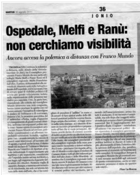
Calabria Ora-pag.36- del 30/08/2011

Publicato da Franco Lofrano a 15:47 Etichette: Politica