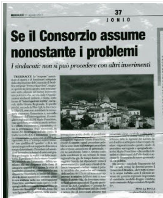
Calabria Ora-pag.37- del 31/08/2011