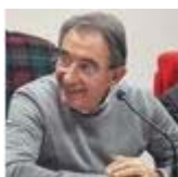
Autore: Franco Emilio Carlino

Per leggere la prima parte della biografia intitolata “ Le origini di Gasparo Fiorino, poeta e musicista rossanese del '500 ” clicca qui